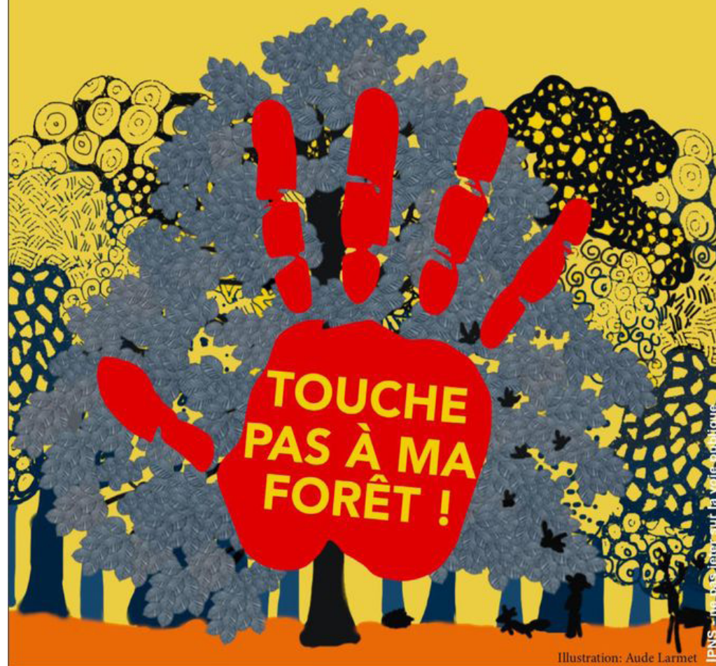
Illustration: Aude Larmet

IPNS - ne pas faire sur la voie publique