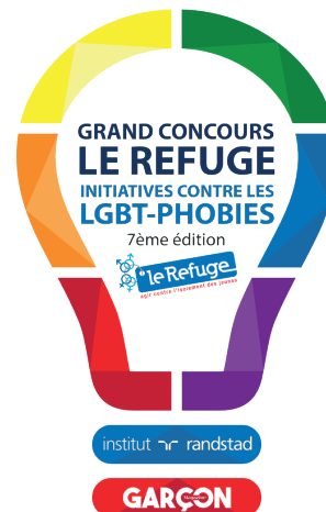
Logo du Grand Concours Le Refuge 2018

Le Refuge et son partenaire l'Institut Randstad récompensent chaque année des associations pour leurs projets originaux de lutte contre les LGBT-phobies. La remise des Prix se déroulera le 15 mai à 18h30 au Lavoir moderne parisien, sous la présidence de la journaliste Leïla Kaddour. Le Grand Prix est doté de 5000 euros par l'Institut Randstad. Le Refuge remettra un chèque de 2000 euros à l'association dont le projet aura séduit les internautes.