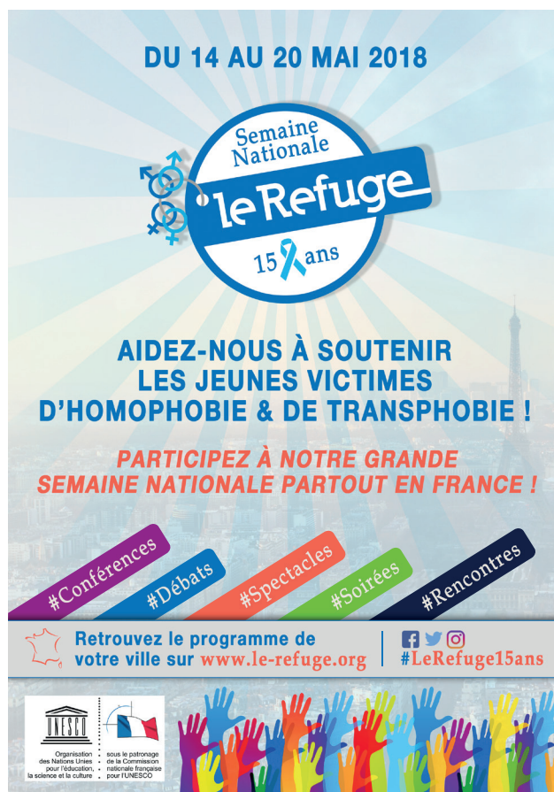
Affiche campagne Le Refuge Semaine Nationale 2018