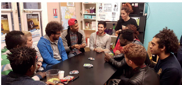
Illustration d'une permanence du Refuge à Montpellier

En 2003, Nicolas Noguier créait Le Refuge à Montpellier, avec une vision novatrice dans le domaine de l'accompagnement des jeunes LGBT confrontés à des situations de violences infra-familiales et/ou en difficulté d'acceptation d'eux-mêmes.